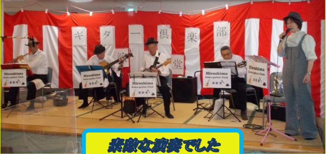
素敵な演奏でした