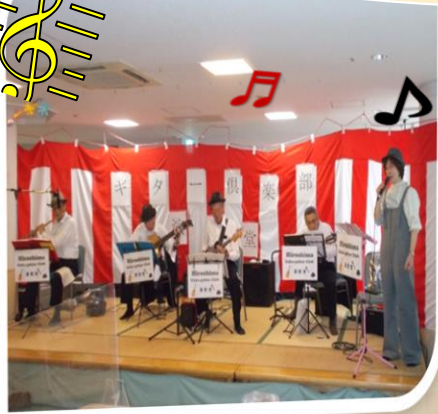
1月15日(水) ギター倶楽部演歌堂