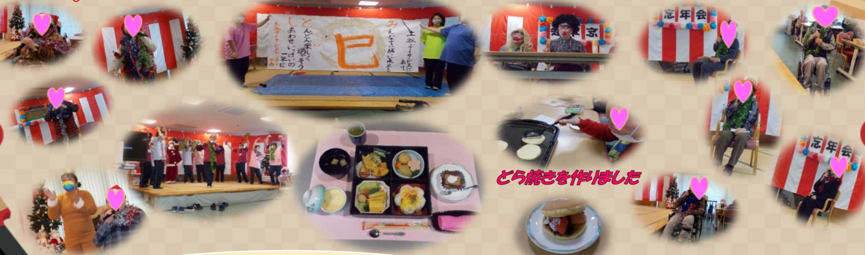
どら焼きを作りました